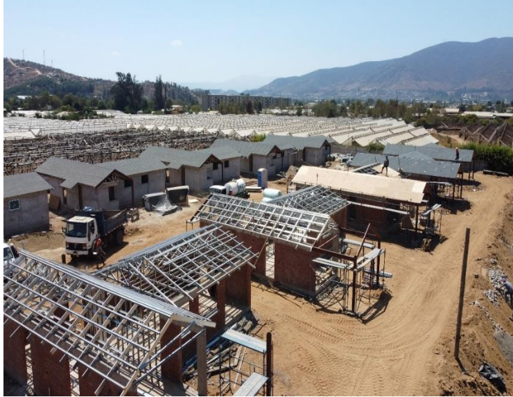
SAN ALFONSO 2018 - LIMACHE